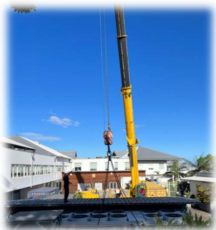
Remplacement du groupe froid

D'autres travaux techniques ont été également engagés comme le remplacement du groupe froid (cf. photo), la rénovation du système audio et vidéo au centre d'hémodialyse ou encore d'importants travaux d'étanchéité des toits et façades.